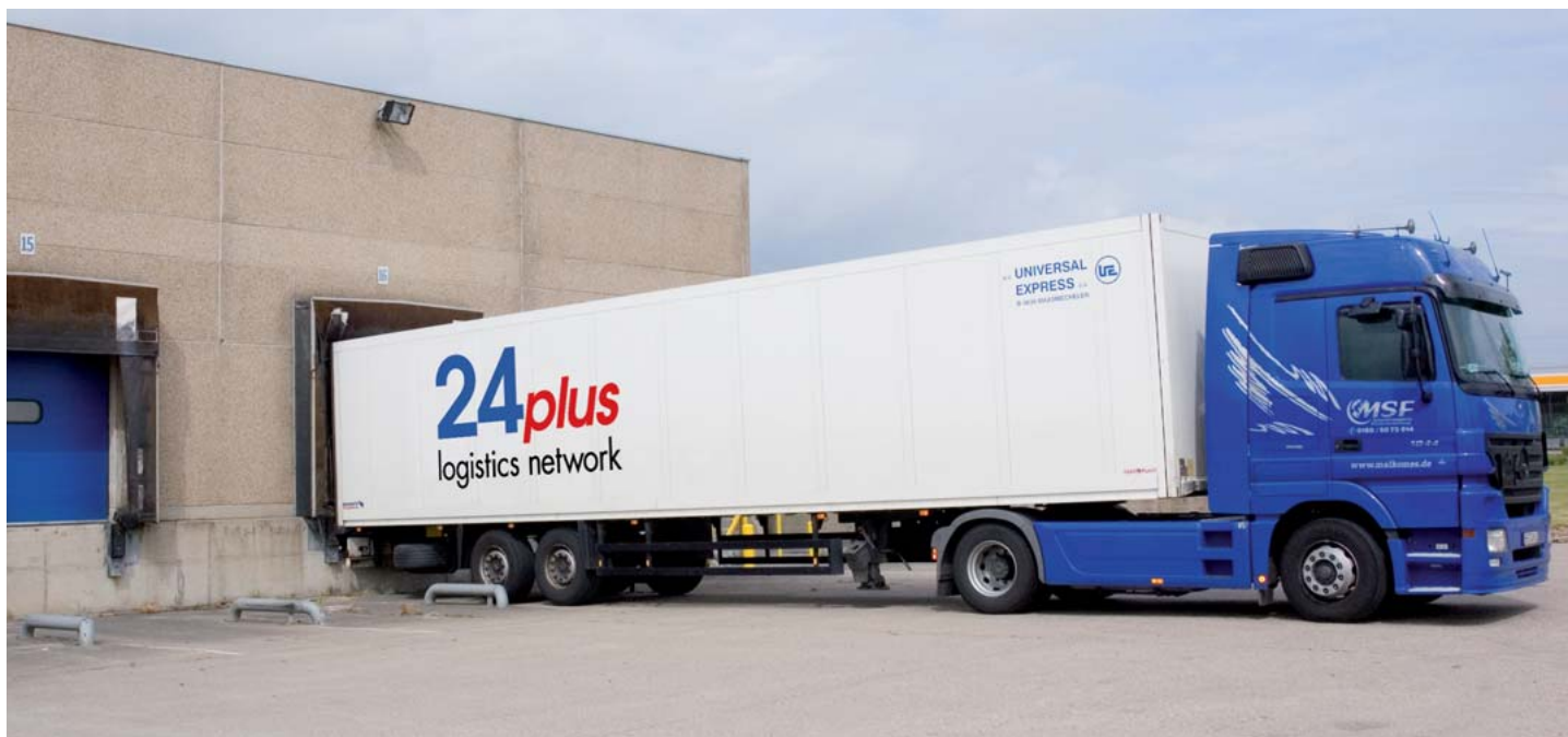
Der Hub-LKW dockt um 6 Uhr morgens an der Universal Express-Anlage im belgischen Maasmechelen an.

The truck docks at the Universal Express facility in Maasmechelen, Belgium at 6 a.m.