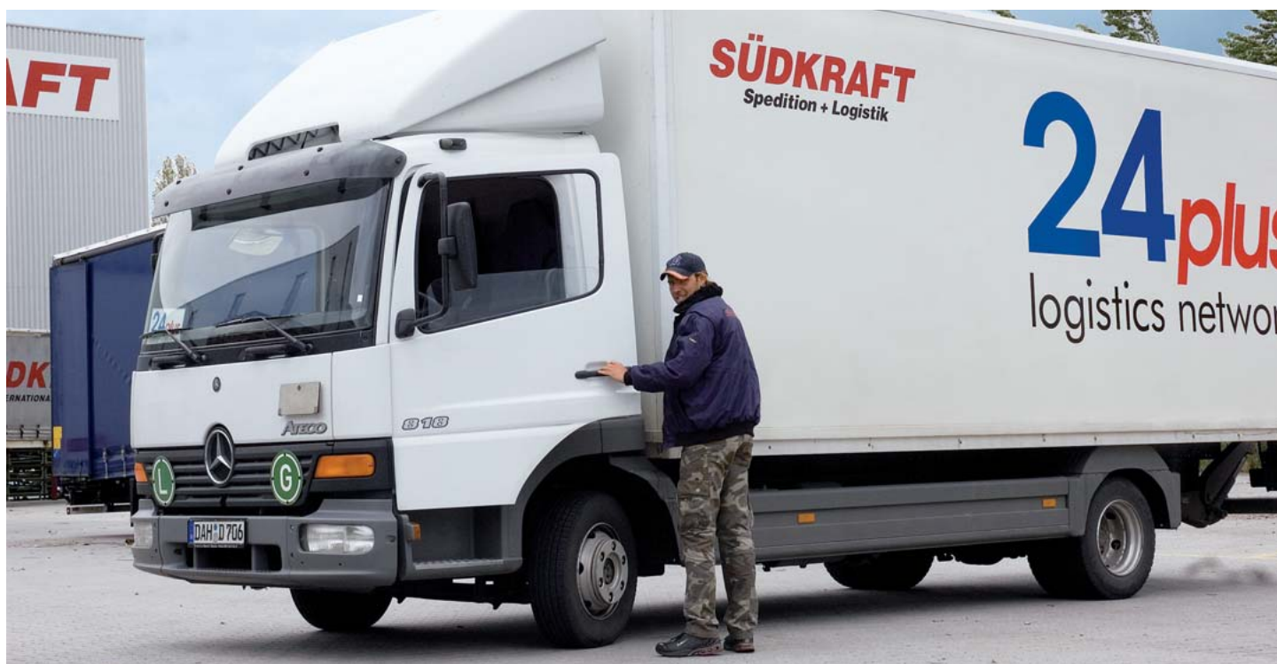
Die Zahl der Südkraft-Fahrzeuge mit 24plus-Beschriftung steigt: Neue Fahrzeuge werden konsequent im Erscheinungsbild der Kooperation beschriftet. The number of Südkraft vehicles featuring the 24plus name is increasing: new vehicles are consistently decorated with the cooperation's logo.